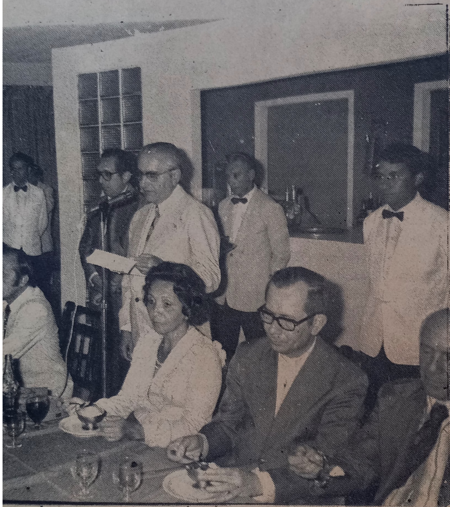
...tas autoridades estiveram presentes.