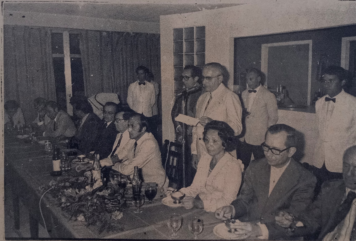
Na reunião da Associação Comercial muitas autoridades estiveram presentes.