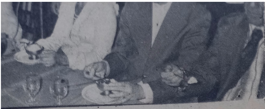
autoridades estiveram presentes.