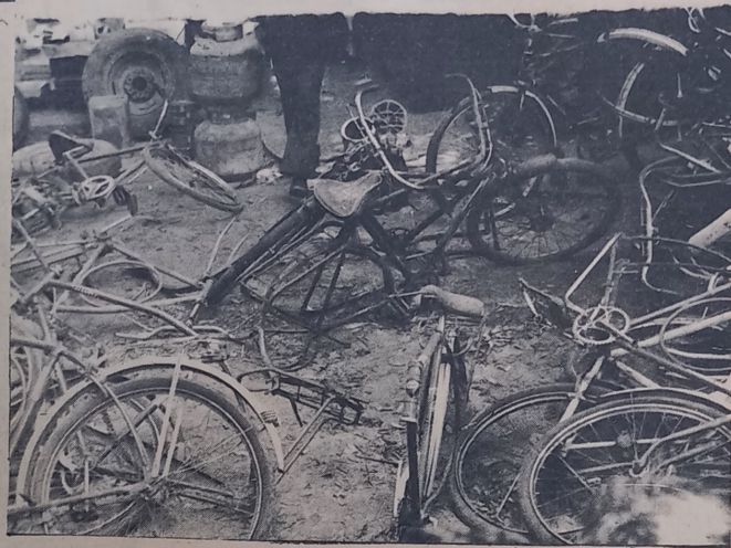
Bicicletas: Depois de apreendidas vão ao leilão.